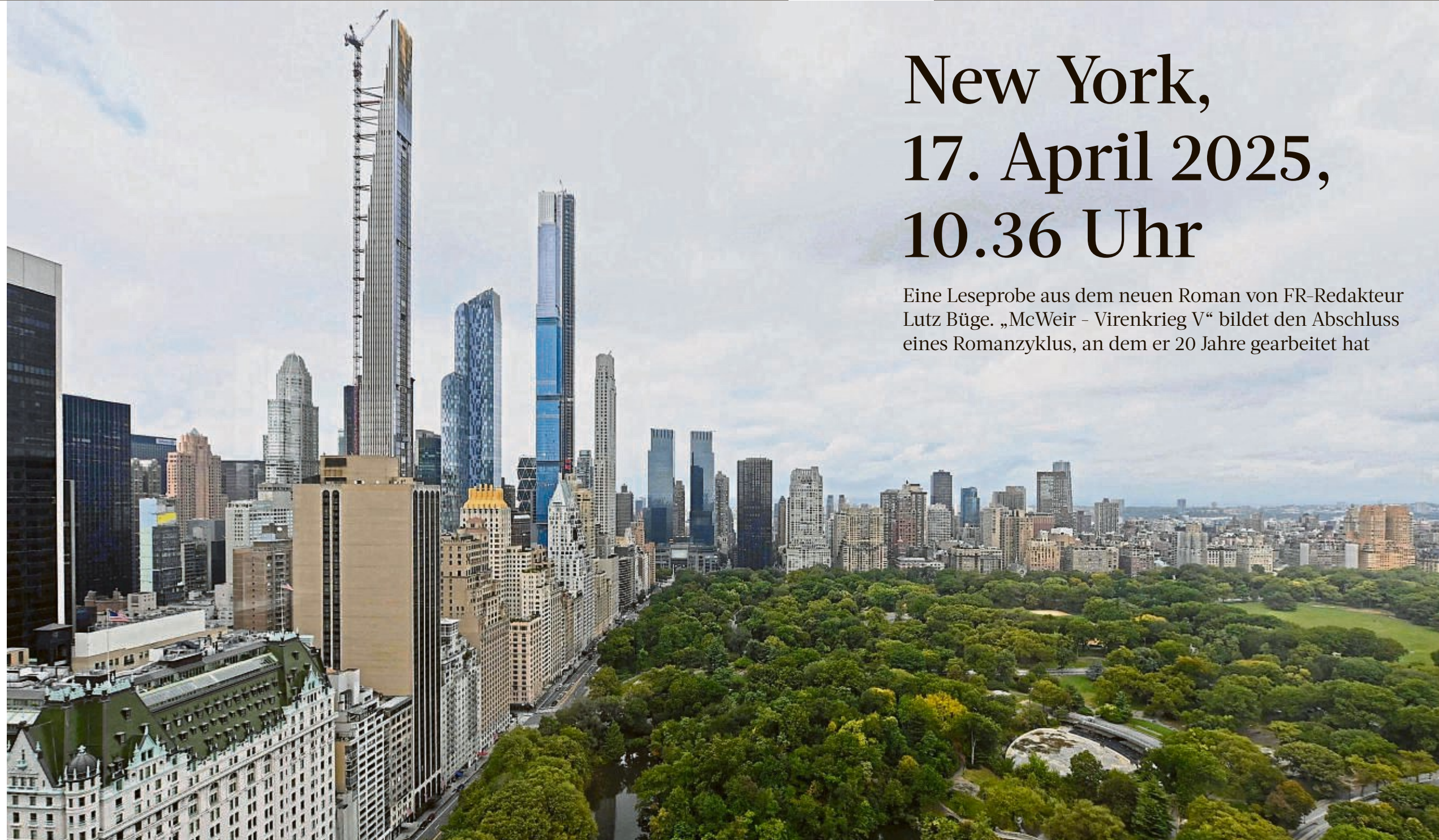
Warum muss es immer New York sein?